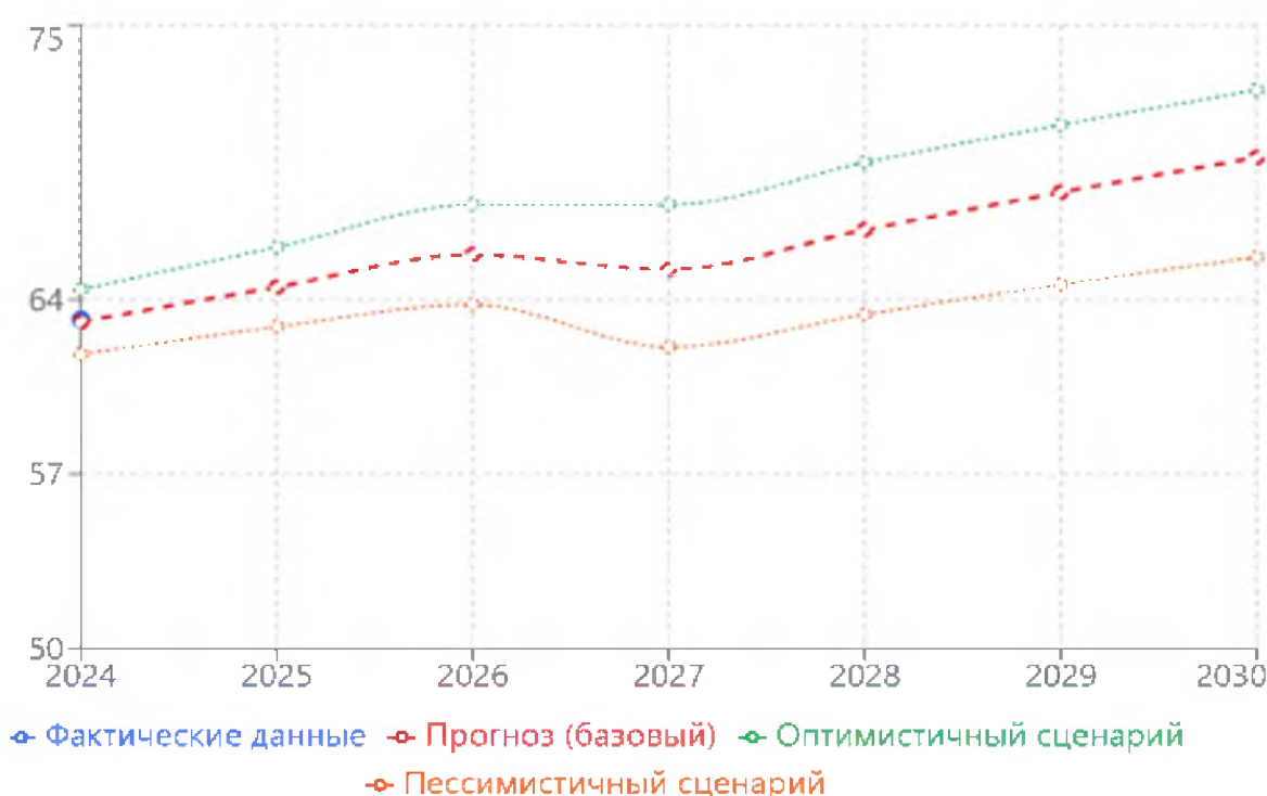
Рисунок 1. Прогноз уровня занятости до 2030 года

Пессимистичный сценарий учитывает возможные внешние шоки, замедление мировой экономики, ограничения в доступе к международным рынкам капитала и технологий. При таких условиях рост занятости будет более медленным, но все же позитивным, достигнув 65,7% к 2030 году (рис.1).